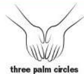
three palm circles