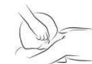
auricular stress reduction