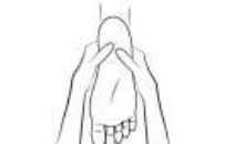
pinpoint zone activation