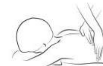
alternating palm slide